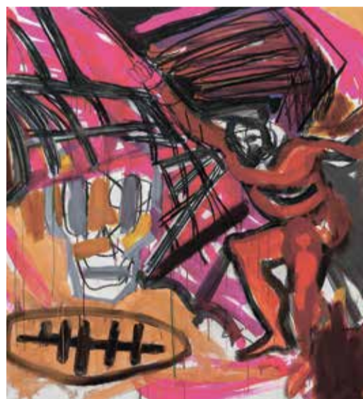
"דרכי תעופה", 2023