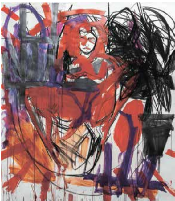
"אישה 01 (המתנדבת)", 2023