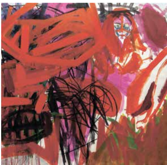
"אישה אדומה", 2023